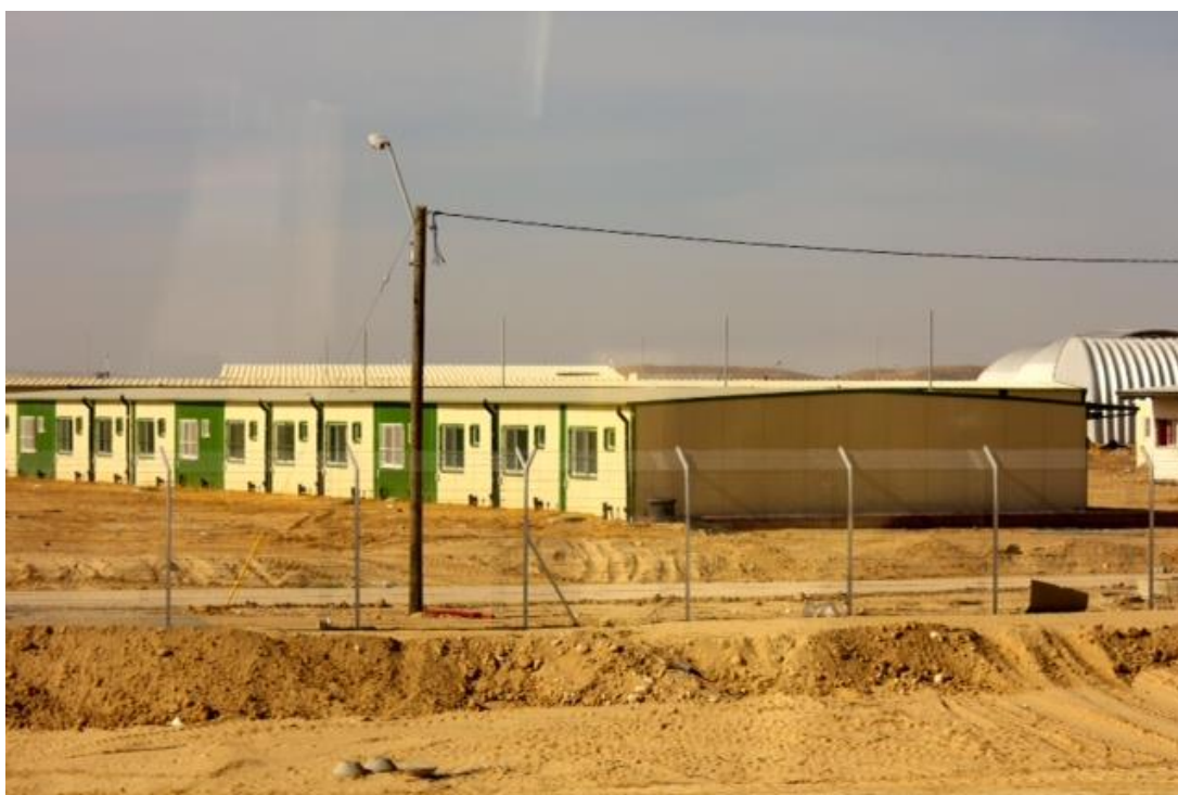
מחנה הכליאה "שדות" על גבול מצרים