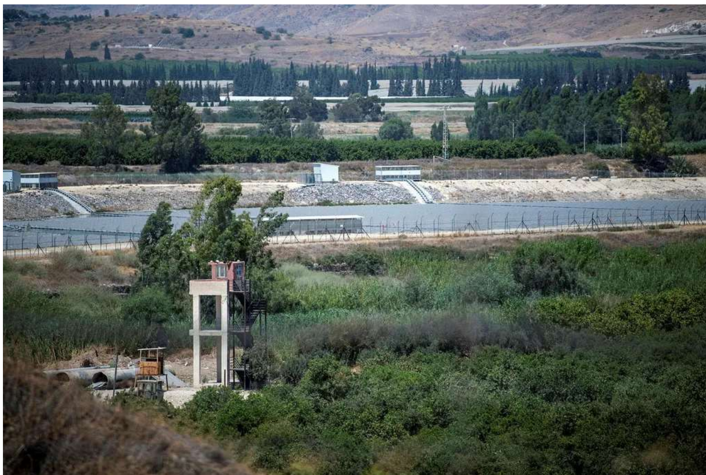
עמדה ירדנית בגבול המשותף, בשבוע שעבר.

הגבול המזרחי, כשליש ממנו בשטחי הגדה המערבית, הפך להיות שער הכניסה העיקרי לישראל עבור מי שמבקש לעשות זאת ללא היתר. הקמת המכשול בגבול מצרים ב-2012 והאבטחה המוגברת בגבולות עם סוריה ועם לבנון גורמים לחדירה מהם להיות כמעט בלתי אפשרית, ובגבול השלום עם ירדן המשאבים של הרשויות נמוכים יותר. כך מוברחים שם כלי נשק, מעטים מהם נתפסים, ונכנסים גם מי שמבקשים לעבוד בישראל – או למצוא בה מקלט.