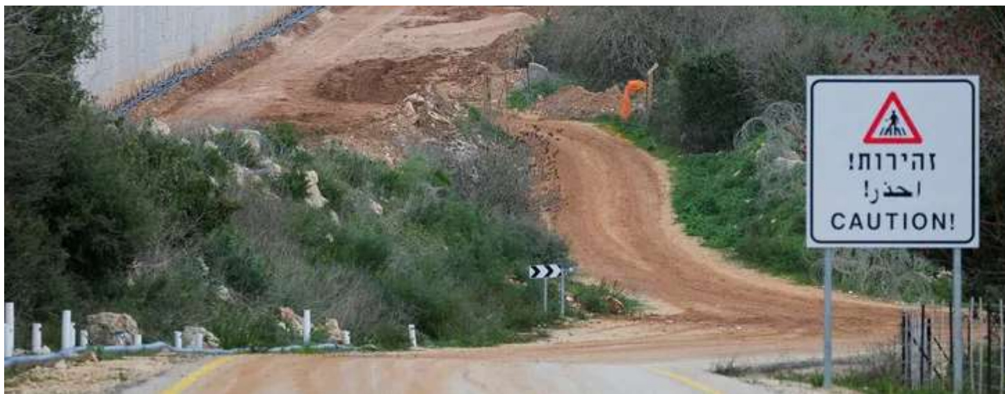
גבול לבנון, במאוס. מכשולים ואבטחה מוגברת הפכו את הגבול הצפוני להיות כמעט בלתי חדיר

לפי הצבא, נוהל החזרה החמה עבר רענון בשנה האחרונה בשל העלייה במספר החציות הלא מורשות של גבול ירדן, והתנאים לביצועה בכל הגבולות חודדו. בין השאר, נקבע כי כל גירוש כזה דורש את אישורו של מפקד הפיקוד שבשטחו התבצעה הכניסה לשטח ישראל. הגירוש יתבצע, לטענת הצבא, רק כלפי מי שאין להם נסיבות הומניטריות, ביטחוניות או פליליות. במקביל, הודק "התיאום הטקטי", כהגדרת גורם צבאי, עם הרשויות בצד השני של הגבול, והירדנים דורשים כי כל החזרה כזו תהיה במעבר גבול רשמי.