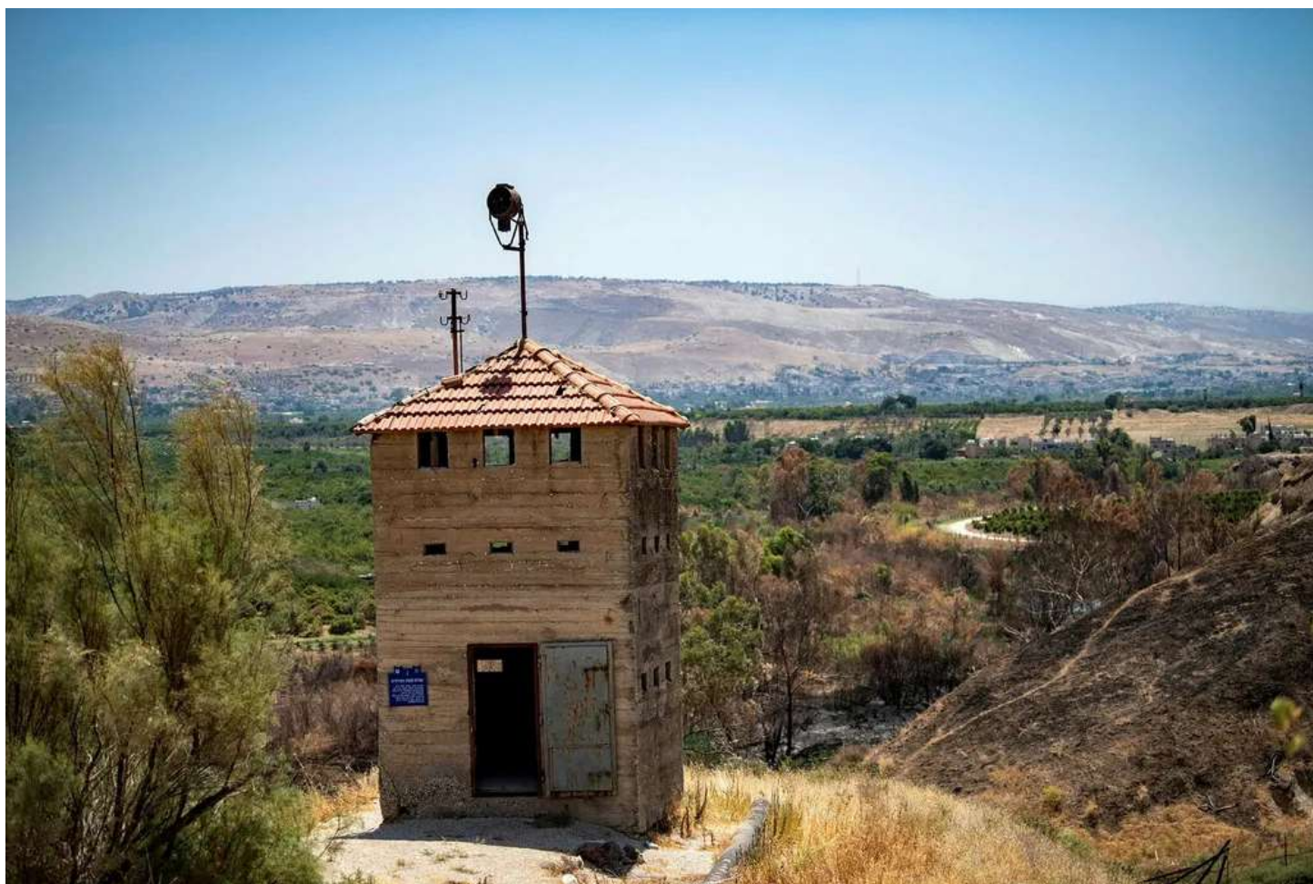
מבנה סמוך לגבול עם ירדן, בשבוע שעבר. ראש המועצה האזורית עמק הירדן אמר כי "הגבול פרוץ"

צה"ל טוען לקיומו של נוהל המסדיר את הבדיקות כך שישקפו את מצב העצורים, אך נמנע מלהציג אותו בטענה שהוא מסווג. לדברי קצינים העוסקים בנושא, ההחזרה המהירה לא תבוצע אם התשאל הראשוני של הנחקר מעלה "טענה מבוססת" שגירושו יעמיד בסכנה של ממש את חייו או את חירות.