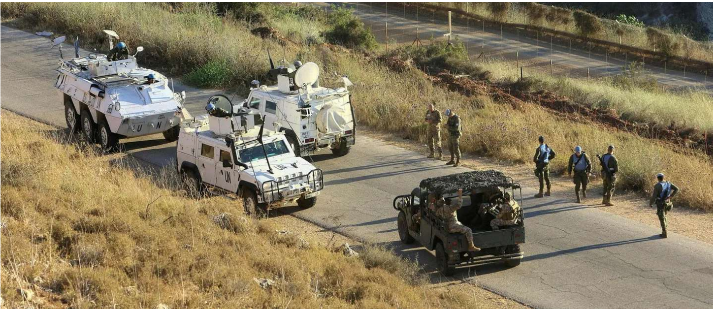
כוחות או"ם וחילי צה"ל סמוך לגבול לבנון, בחודש שעבר. הצבא נמנע מלהציג את הנוהל שמסדיר לטענתם המסדיר את הבדיקות

תשעת חבריו לבקשת המקלט נעצרו זמן לא רב לפניו או אחריו, ומלבדו כולם שוחררו ממעצר. המדינה אינה נוהגת להחזיק במתקני כליאה את מי שאין להם "אופק לגירוש" — אפשרות להחזיר אותם לארצם או סיכוי סביר שתימצא מדינה שתקלוט אותם — אך הוא נותר עצור, בין השאר כי לא גייס את הערבות הדרושה בגובה 10,000 שקל.