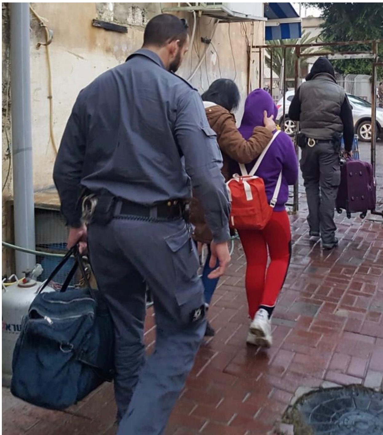
בתמונה: אם ובתה נעצרות על ידי פקחי רשות ההגירה, 7 בינואר 2020.