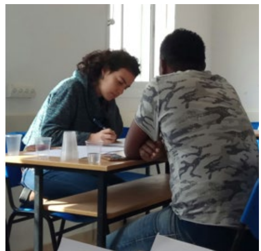
מתנדבת המוקד בביקור בחולות, פברואר 2018

במהלך השנה, הקו החם קיים 73 ביקורים במתקני הכליאה שיחזרו 16 לקוחות ממשמורת, שלח 1714 מכתבים לגופים ממשלתיים בשמם של הפונים וליווה 58 אנשים במפגשים השונים מול הרשויות.