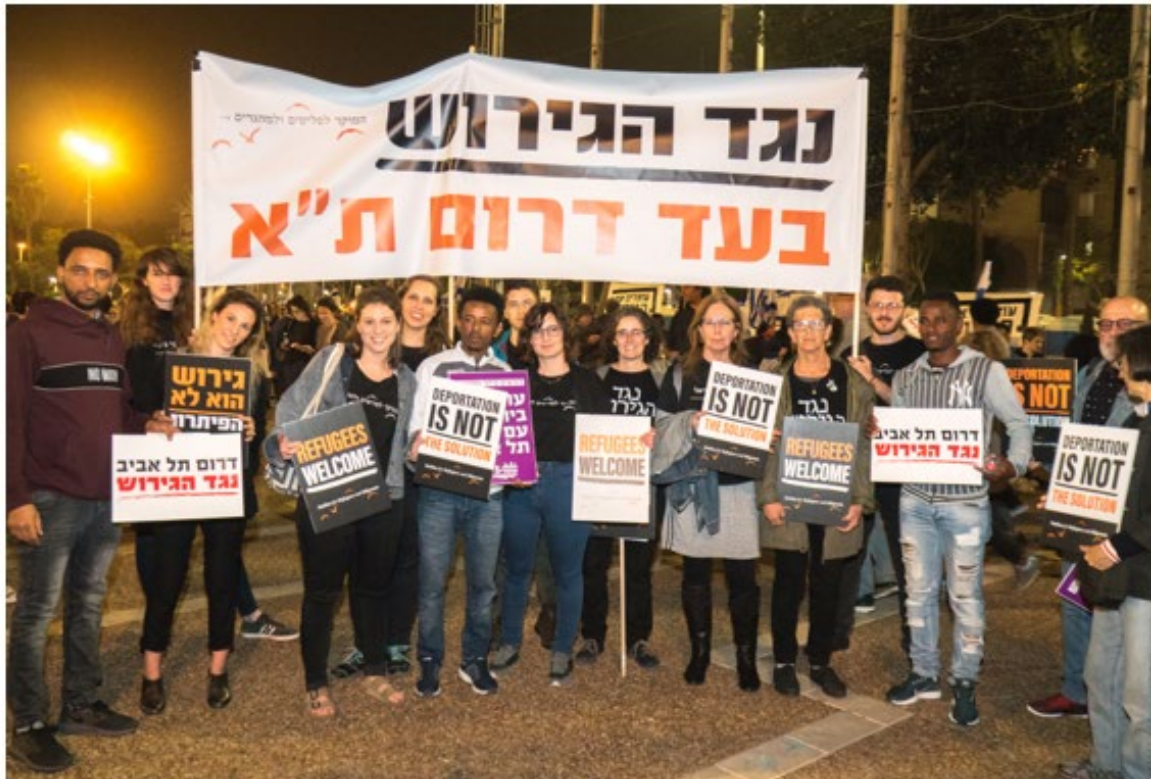
צוות המוקד בהפגנה בביכר רבין, 24 במרץ 2018

כחלק מעתירה משותפת של המוקד והתוכנית לזכויות פליטים באוניברסיטת תל אביב, בשמם של ארגוני זכויות הפליטים, הממשלה הודתה שאין אפשרות ברת קיימא לגרש את מבקשי המקלט למדינות שליטות ובכך באה אל סופה תוכנית זו.