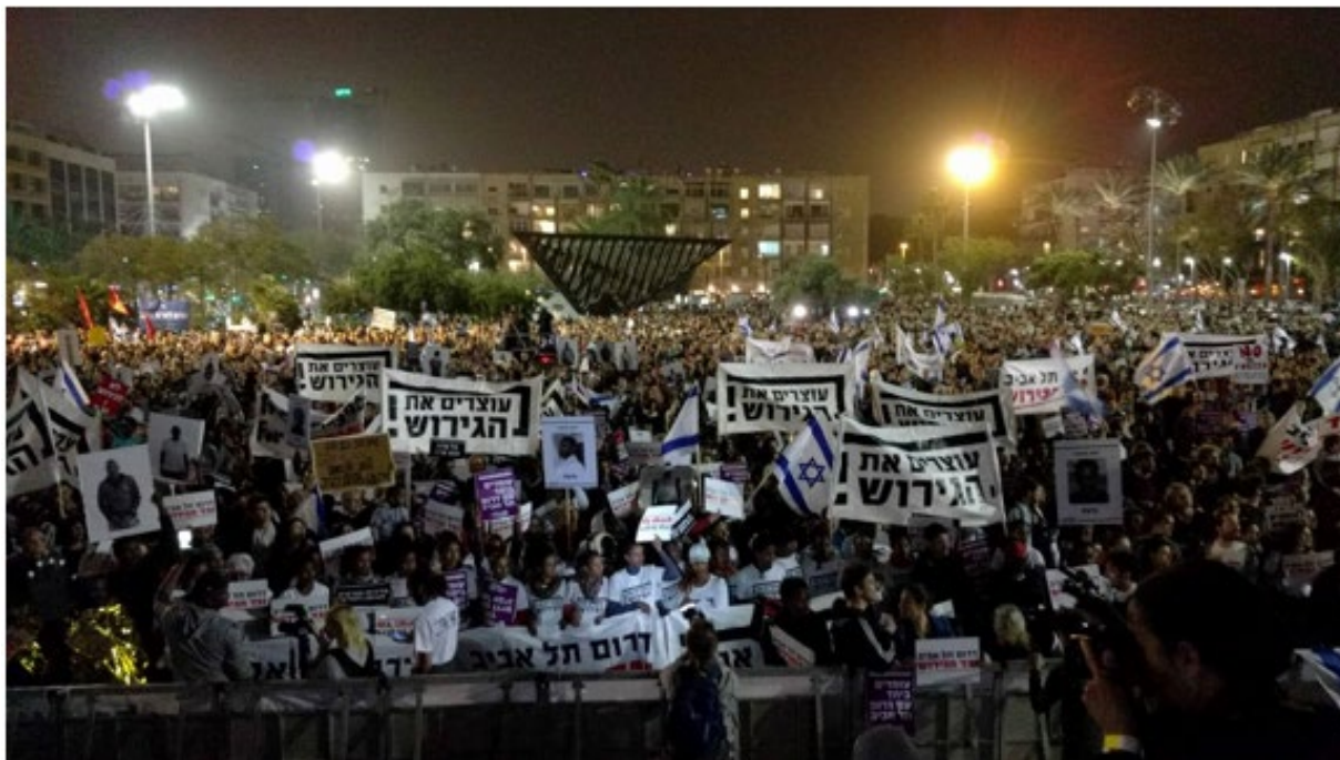
25,000 איש מפגינים בכיכר הבין ב-24 במרץ 2018

במקביל לעבודה הישירה עם קהילת מבקשי המקלט, עסקנו בפעילות ציבורית, תקשורתית ובעבודת סינגור. בין ינואר לאפריל, יזמנו 219 אייטמים בתקשורת, בין היתר בפריים טיים הישראלי ובגופי תקשורת בינלאומיים מוכרים. פנינו לציבור הישראלי ולקהילה היהודית בחו"ל, וסיפקנו להם מידע אודות הטרגדיה המתפתחת. לקחנו חלק משמעותי בשתי ההפגנות הגדולות בתל אביב, הראשונה, בה נכחו 20,000 איש ואשה, נערכה ב-24 בפברואר, והשנייה, שנערכה חודש לאחר מכן, בה נכחו 25,000 איש.