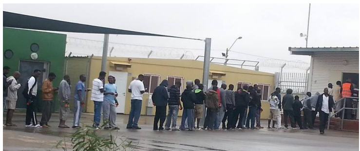
בתמונה: תור לחלוקת מזון בחולות

"רב הזמן אני עומד בתור: יש תור כדי לקבל אוכל, שלוש פעמים ביום אני עומד כדי לחתום. אבל התור הכי ארוך: כשרוצים לצאת ולהיכנס מהכלא. בשבתות צריך לעמוד שעתיים בתור גם כדי לצאת וגם כדי להיכנס. כשנכנסים, הסוהרים בודקים אותנו טוב טוב, לבדוק שאנחנו לא מכניסים אוכל פנימה. אני לא מבין למה יש כזה תוך ארוך גם כדי לצאת. ממילא אין לנו כלום בפנים. מה כבר אנחנו יכולים להוציא החוצה? מה יש לבדוק?"