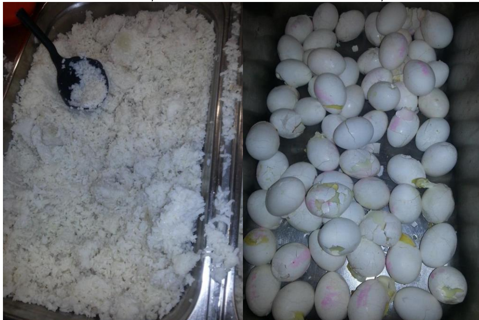
בתמונה: ארוחת ערב בחולות

הארוחות מוגשות שלוש פעמים ביום: בין 7:00 ל-8:00, בין 12:00 ל-13:00 ובין 19:00 ל-20:00. בשבועות הראשונים להקמת הכלא אופיינו הארוחות בכאוס ובניהול קלוקל של הכמויות המוזמנות, כך שמבקשי מקלט רבים נותרו ללא מזון במהלך ארוחה אחת או יותר. כיום נראה כי עניין הכמויות נמצא תחת שליטה, אך תוכנן של הארוחות עדיין אינו מעיד על בניית תפריט מחושבת ואין התחשבות בהרגלי צריכת המזון של העצורים.