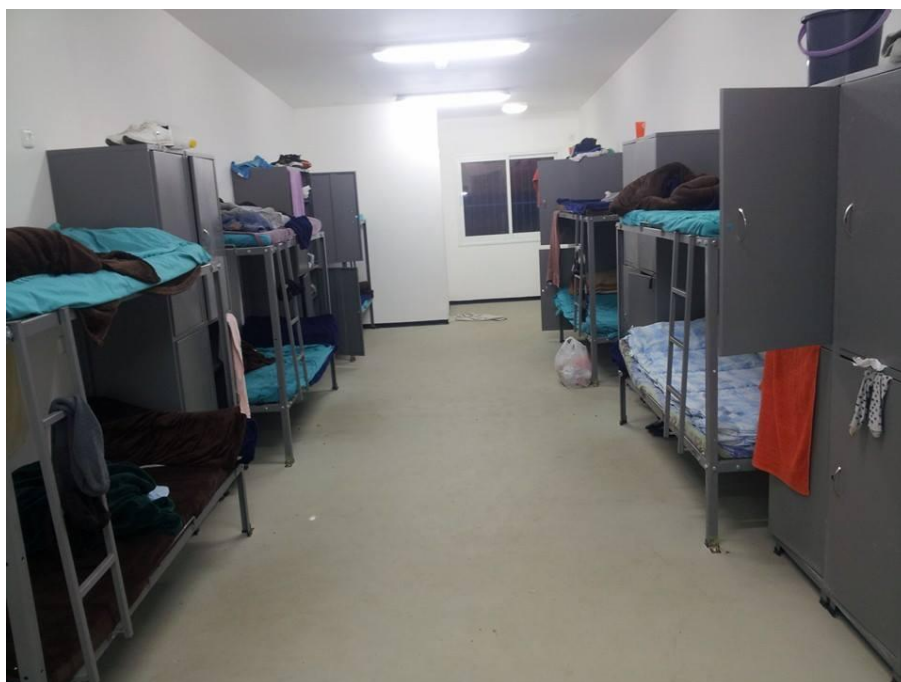
בתמונה: חדר מגורים בחולות.

כלא ”חולות” מחולק לפלחים, וכל פלח מחולק לאגפים. נכון לכתיבת שורות אלו, יש במקום שני פלחים פעילים, ופלח שלישי עתיד להיפתח עד לחג הפסח. 24 האחד משמש כמרכז מנהלי של המתקן וכולל בתוכו את משרדי השב”ס, והשני מכיל ארבעה אגפים פעילים. ברמת התכנון, האסירים מחולקים בין האגפים לפי מדינות המוצא – באגפים A ו-C שוכנים אזרחי סודאן ואגפים B ו-D מאוכלסים בחלקם בסודאנים ובחלקם על-ידי יוצאי אריתריאה. בפועל, הפיקוח על הסדרי המגורים רופף והשוהים חופשיים לעבור מאגף לאגף כרצונם, בלי קשר למדינת המוצא.