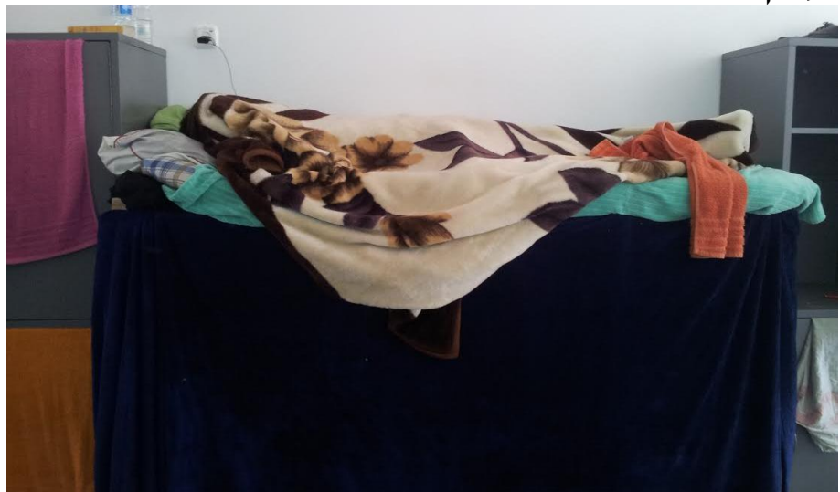
בתמונה: מיטות העצורים בחולות מאויישות גם בשעות היום

"כל היום אני לא עושה כלום. רב הזמן אני שוכב במיטה. מדוכא"