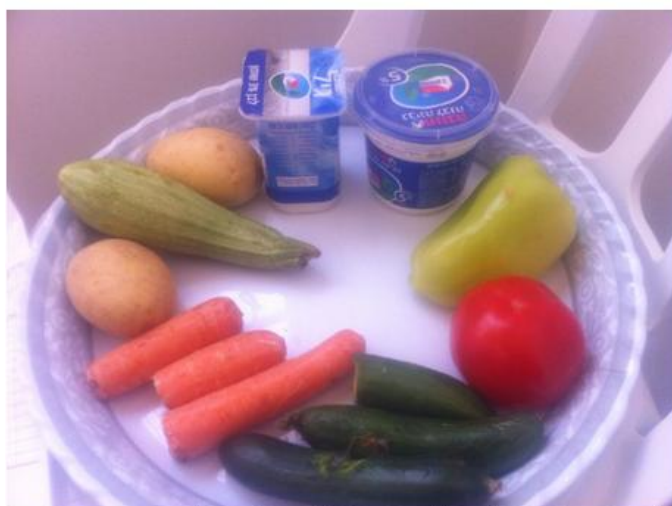
בתמונה: ארוחה מותאמת לעצור הסובל בעיה רפואית, אך ללא אפשרות לבישול תפוחי האדמה והקישוא

הכנסת מזון מבחוץ היא איסור שנאכף בחומרה, בין השאר עקב חשש תברואתי שכן למבקשי המקלט אין גישה למקרר והאפשרות לשמור מזון כמעט ואינה קיימת. בנוסף, לא קיימים בכלא אמצעים להכנת אוכל מבושל, כגון כיריים או תנורים, כך שגם האפשרות להכין אוכל טרי נשללת מהעצורים. נותרת בידיהם האפשרות לרכישת מזון מוכן מחוץ למתקן, מותרות שמתאפשרות לעתים רחוקות עם תקציב של 16 ₪ ליום והמרחק הרב ממקור לרכישת מזון. חנות המכולת הקרובה ביותר נמצאת במרחק כעשרה ק"מ מהמתקן, במושב קדש ברנע, המוקף בגדר ושער שמונע את כניסתם של העצורים. סוגיית המזון היא רק דוגמא אחת מני רבות להעדר חופש הבחירה ולשלילת החירות של העצורים.