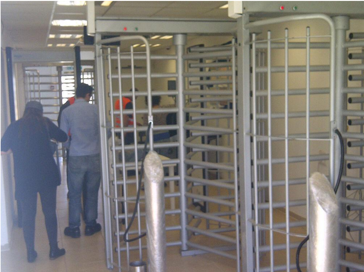
בתמונה: הכניסה ל"מרכז השוהים הפתוח" חולות