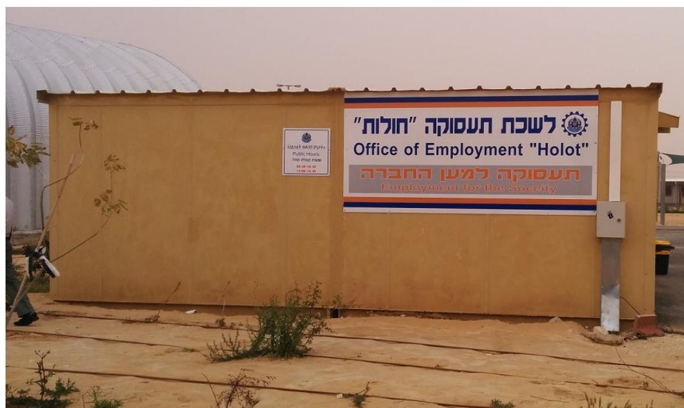
בתמונה: לשכת התעסוקה בחולות

עבור מעטים מהעצורים בחולות קיימת אפשרות תעסוקה בתחזוקת המתקן עצמו ואספקת שירותים לפי סעיף 32 ז' לחוק למניעת הסתננות. רק כ - 179 מהשוהים במרכז נרשמו למאגר המועסקים בו. 28 עבור עבודתם אמורים העצורים לקבל 12 ש"ח לשעה על פי התקנות. 29 בינואר הועסקו במתקן 59 עצורים, בפברואר הועסקו 78 עצורים - רק חמישה אחוזים מהעצורים במתקן.