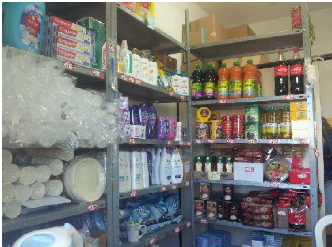
בתמונה: כל מוצרי הקנטינה למבקשי המקלט כפי שנראו ביום 26 במרץ 2014.

בנוסף לחדרי המגורים, ישנו באגף מועדון, חדר המיועד לפעילויות חברתיות אך בפועל מכיל רק מכשיר טלוויזיה ומספר כסאות. באגף A פועלת קנטינה אחת ובה מצרכי יסוד, חומרי ניקוי, מוצרי טיפוח ומספר מצומצם ביותר של חטיפים. מלבד המתואר לעיל, המתקן שומם ולא מספק אפשרויות תעסוקה לשעות הפנאי האינסופיות שנכפו על השוהים, כפי שעולה מדבריהם.